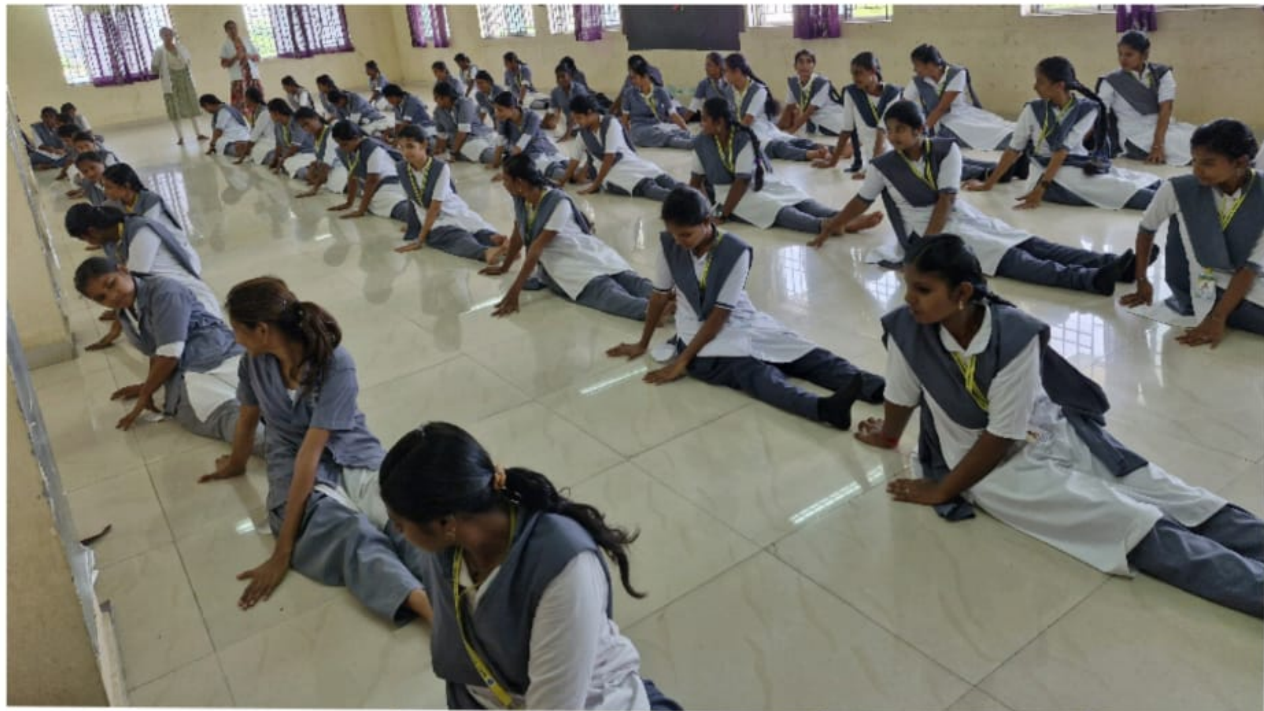
Pre_Yoga day event for DPharm Students GSMC Palayamkottai 5/6/2024