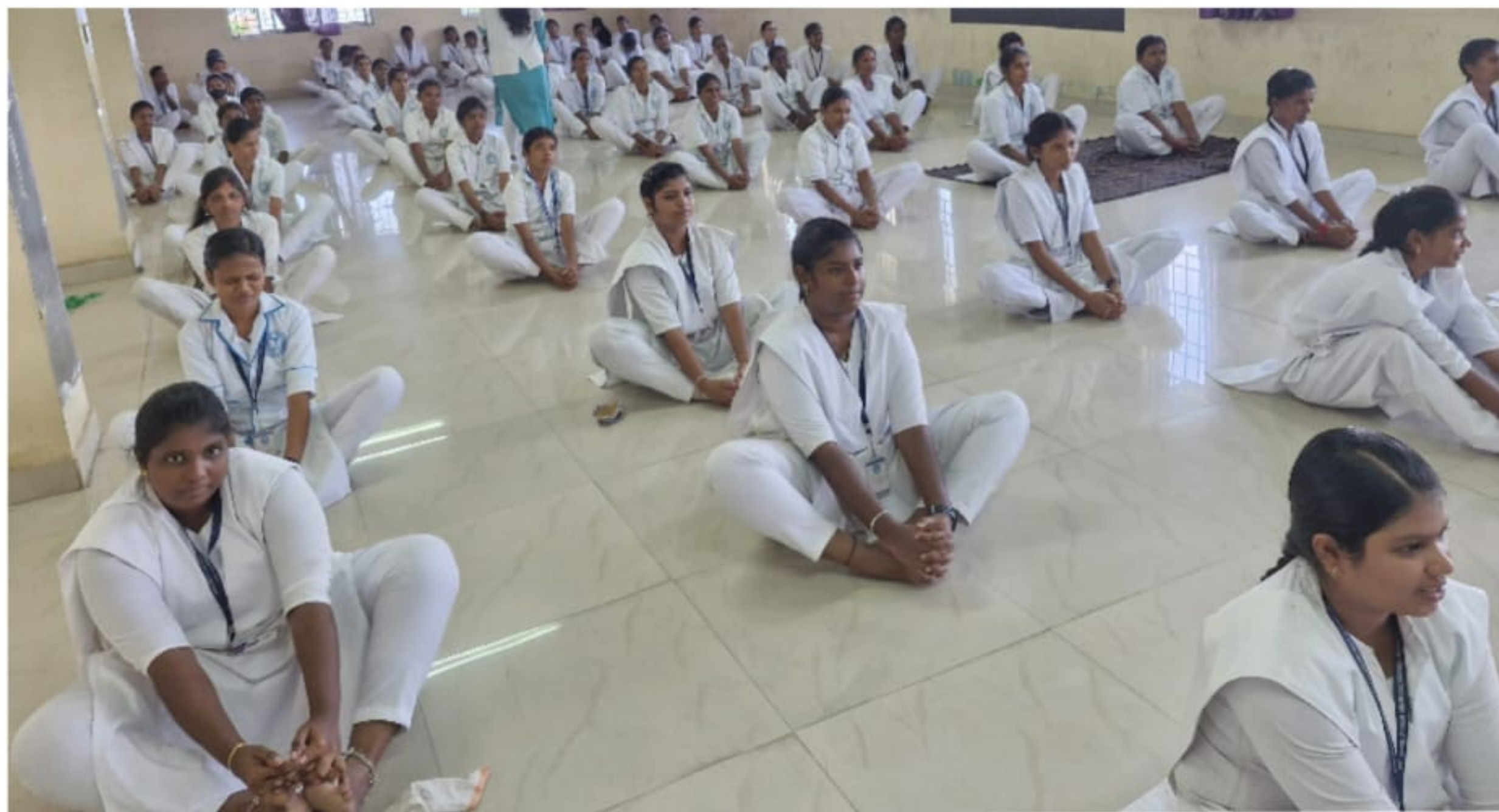
Pre_Yoga day event for Nursing Students GSMC Palayamkottai 6/6/2024